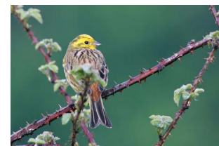
De geelgors maakt graag gebruik van struweel op boerenland

In dit plan, ook wel biodiversiteitsplan genoemd, maken we een analyse van de natuur en biodiversiteit op en om uw agrarisch bedrijf. We brengen samen in beeld welke natuurwaarden er al aanwezig zijn en welke u kunt ontwikkelen. We bespreken met u wat inpasbaar is binnen uw bedrijf en attenderen u op de mogelijkheden voor subsidies of vergoedingen uit de zuivel.